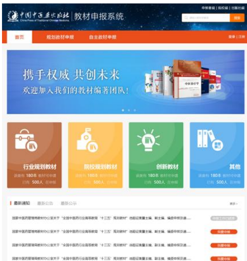
(教材申报系统首页)